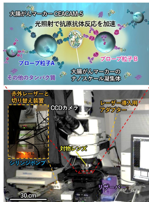
図 1:(上)MF-LAC-SYS で抗体修飾ビーズを用いて CEACAM-5 とナノスケール凝集体を高感度検出するイメージ。(下)MF-LAC-SYS 標準機の写真。