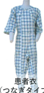
患者衣 (つなぎタイプ)