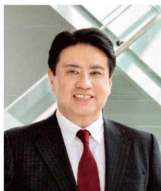
野田哲生 UICC 日本委員会委員長 がん研究会がん研究所所長