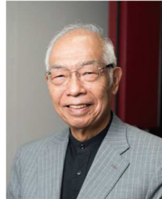
垣添忠生 UICC 日本委員会幹事 日本対がん協会会長