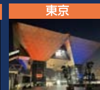
東京 東京ビッグサイト