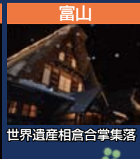
富山 世界遺産相倉合掌集落