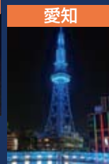
愛知 中部電力MIRAI TOWER