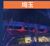
埼玉 さいたまスーパーアリーナ 埼玉スタジアム2002