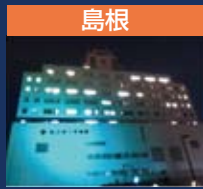
島根 松江赤十字病院・ さんいん中央テレビ鉄塔