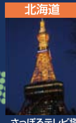
北海道 さっぽろテレビ塔