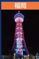
福岡 博多ポートタワー