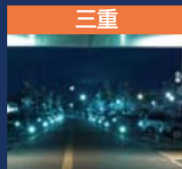
三重 三重大学医学部附属病院