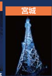
宮城 仙台スカイキャンドル