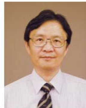
発がん制御研究部長